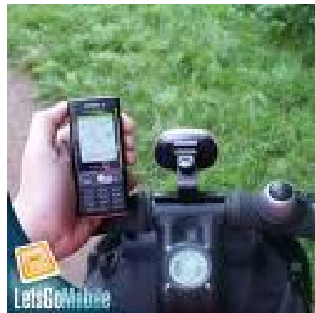
Location Based Service